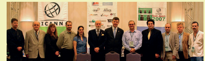
Miembros de la NARALO en la firma del Memorando de Entendimiento en 2006 en San Juan, Puerto Rico

La NARALO es una de las cinco organizaciones regionales dentro de At-Large. Las cinco RALO nuclean a nuestras ALS y a miembros independientes en sus regiones. Las RALO conforman un foro de comunicación y un punto de coordinación para que sus miembros promuevan y fomenten la participación de las comunidades regionales de usuarios de Internet en las actividades de la ICANN. Cada RALO tiene sus propios documentos de organización, que incluyen un Memorando de Entendimiento con la ICANN. La NARALO firmó sus memorandos de entendimiento con la ICANN en 2006.