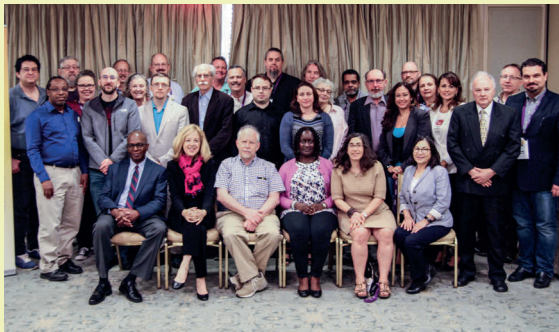
Miembros de la NARALO

La NARALO está formada por Estructuras de At-Large (ALS) que se reúnen en línea el segundo lunes de cada mes, y en forma presencial en las reuniones de la ICANN y en su Asamblea General. Nuestros miembros provienen de Estados Unidos, Canadá y Puerto Rico, y hablan inglés, francés y español. La ICANN ofrece becas a los participantes para que asistan a las reuniones públicas de la organización y así podamos tener una diversidad de voces.