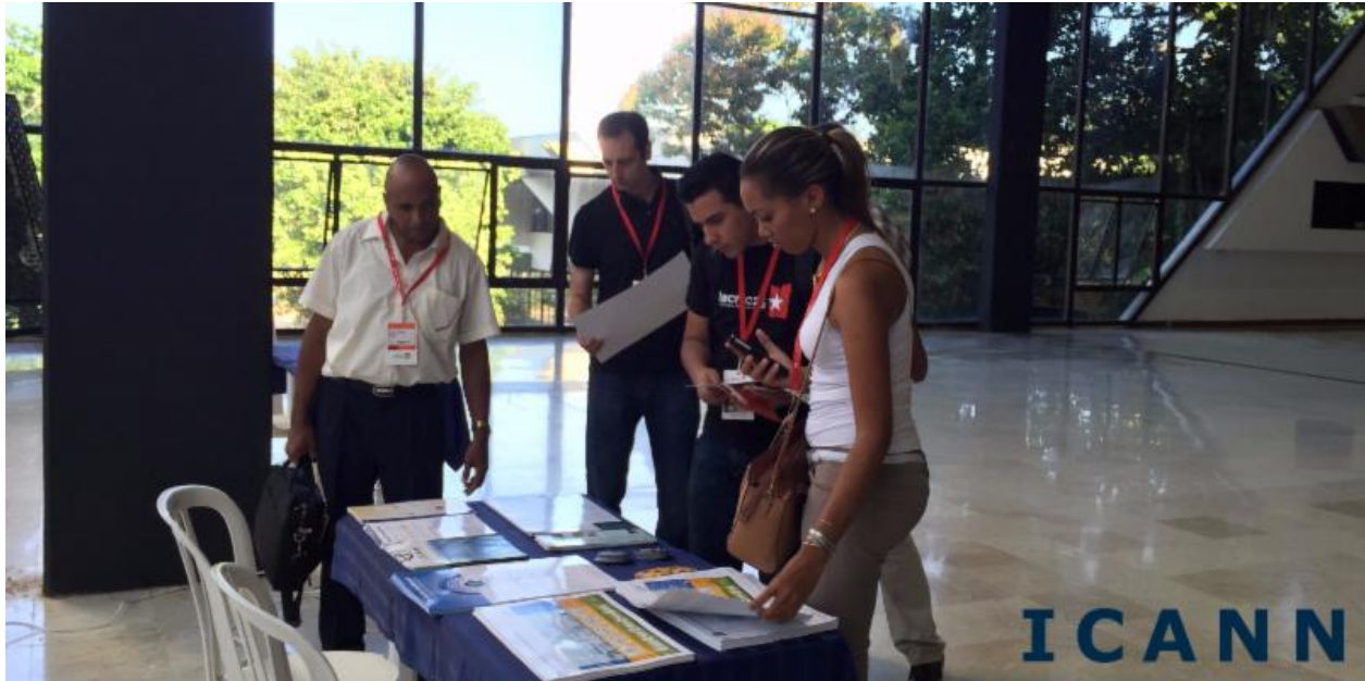
Participantes retirando o material da ICANN no local (Palácio de Convenções de Havana)