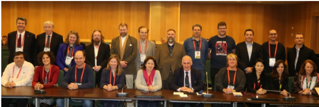
Consejo de la GNSO, 2015-2016