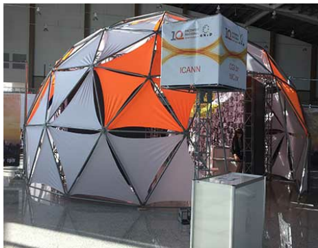
Stand de l'ICANN lors de l'événement de l'ANID