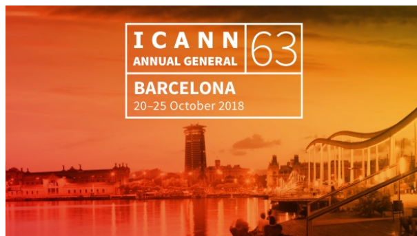
Sitio web de la reunión ICANN63

La reunión ICANN63 comienza en sólo cinco días. El sitio web de la reunión está disponible e incluye el programa final de actividades, la aplicación de reuniones de la ICANN para teléfonos móviles y los informes previos a la reunión.