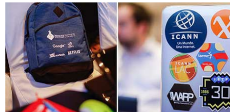
A ICANN é um patrocinador de longa data dos eventos do LACNIC.

A reunião anual do registro de endereços da Internet da América Latina e Caribe (LACNIC) ocorreu em San José, Costa Rica, de 26 a 30 de setembro. Como sempre, a reunião foi realizada em conjunto com a conferência anual do LACNOG. O programa geral consistiu em um dia de oficinas de treinamento em novas tecnologias, segurança e implementação do protocolo da Internet versão 6 (IPv6) e quatro dias de palestras e painéis de discussão sobre questões atuais, além de conferências proferidas por especialistas internacionais renomados.