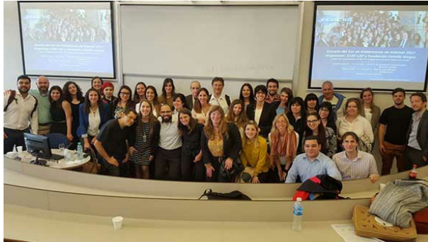
Participants au « Governance Primer » - Buenos Aires (Argentine)