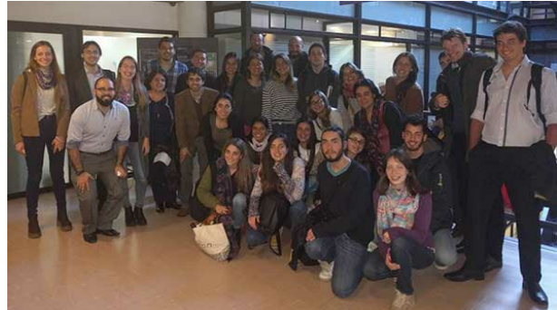
Participants au « Governance Primer » - Montevideo (Uruguay)