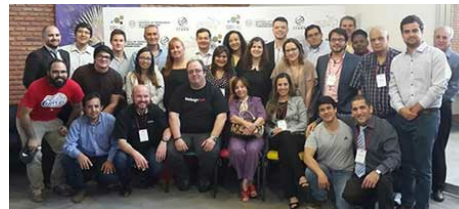
Les diplômés de la première formation entreprise au CEI LAC

Le premier Centre d'entrepreneuriat et d'Internet de l'Amérique latine et des Caraïbes (CEI LAC) a ouvert ses portes à Asunción (Paraguay) le 12 octobre. Ce centre est le deuxième à être lancé au monde ; le premier se trouve en Égypte. L'évènement est une initiative conjointe de l'ICANN, de SENATICs et de LACTLD.