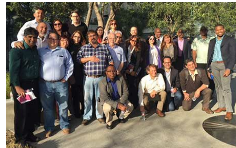
Reunião da LACRALO