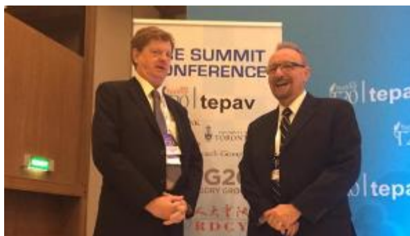
ICANN и саммит G20 в Турции - (15-16 ноября 2015 года, Анталия, Турция)

Работа нашего центрального офиса началась в мае 2013 года, когда мы размещались во временных служебных помещениях. Уже почти год как мы переехали в новое, более просторное офисное помещение в Стамбуле. С самого начала своей деятельности мы берем на работу местный персонал и расширяем присутствие не только в Стамбуле, но и по всему региону EMEA. Всего у нас в штате 51 сотрудник: 14 человек работают непосредственно в центральном офисе, а остальные распределены по всему региону. Сотрудники стамбульского офиса предоставляют разнообразные услуги, оказываемые ICANN, в том числе в таких сферах, как поддержка разработки политики, соблюдение договорных обязательств, услуги регистратур и регистраторов, взаимодействие с заинтересованными сторонами, конференции ICANN, подбор и предоставление кадров, информационные технологии, администрирование и деятельность Правления.