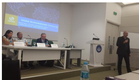
Панель по гражданскому обществу и ICANN - (Стамбул, Турция, 2.09.2015) Панельное обсуждение с участниками из