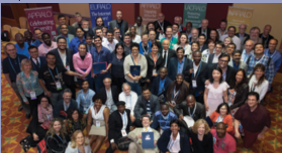
Члены сообщества At-Large на втором саммите At-Large, прошедшем в Лондоне в июне 2014 года.

EURALO действует на основании собственных организационных документов, включая меморандум о взаимопонимании с ICANN. В связи с тем, что EURALO играет ключевую роль в отношении региональных стратегий ICANN, организация работает над повышением уровня осведомленности о критически важной инфраструктуре системы доменных имен совместно с персоналом отдела глобального взаимодействия с заинтересованными сторонами ICANN - .