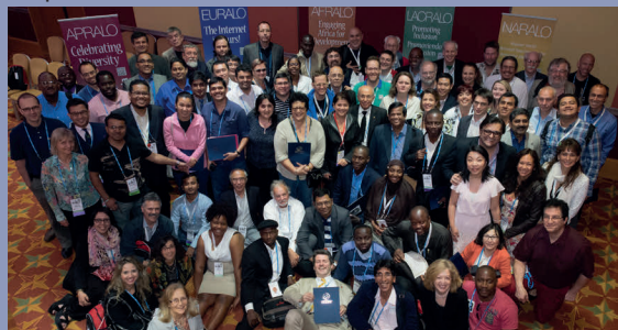
Члены сообщества At-Large на втором саммите At-Large, прошедшем в Лондоне в июне 2014 года.

EURALO действует на основании собственных организационных документов, включая меморандум о взаимопонимании с ICANN. В связи с тем, что EURALO играет ключевую роль в отношении региональных стратегий ICANN, организация работает над повышением уровня осведомленности о критически важной инфраструктуре системы доменных имен совместно с персоналом отдела глобального взаимодействия с заинтересованными сторонами ICANN - .