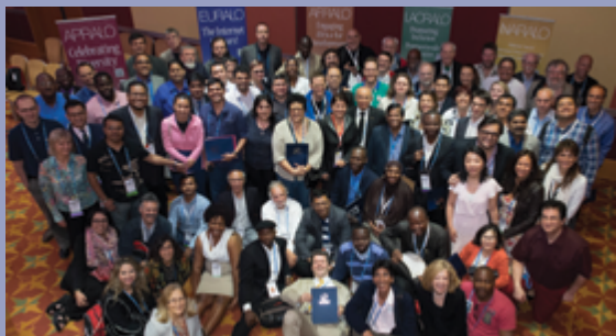
Mitglieder der At-Large-Community beim zweiten At-Large-Gipfel, der im Juni 2014 in London stattfand.

EURALO wird von unseren eigenen Organisationsdokumenten geregelt, zu denen unter anderem eine Absichtserklärung mit ICANN gehört. Als zentraler Mitwirkender bei den regionalen Strategien von ICANN arbeitet EURALO mit dem Global Stakeholder Engagement-Team von ICANN zusammen, um auf die missionskritische Infrastruktur für das Domain Name System aufmerksam zu machen.