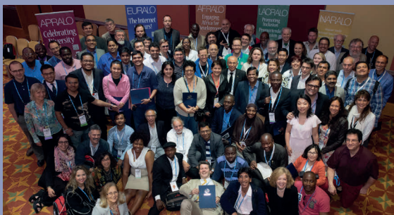
Mitglieder der At-Large-Community beim zweiten At-Large-Gipfel, der im Juni 2014 in London stattfand.

EURALO wird von unseren eigenen Organisationsdokumenten geregelt, zu denen unter anderem eine Absichtserklärung mit ICANN gehört. Als zentraler Mitwirkender bei den regionalen Strategien von ICANN arbeitet EURALO mit dem Global Stakeholder Engagement-Team von ICANN zusammen, um auf die missionskritische Infrastruktur für das Domain Name System aufmerksam zu machen.