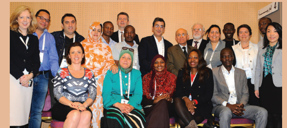
أعضاء AFRALO وأعضاء مجتمع At-Large في اجتماع ICANN55 في مراكش، مارس 2016.

خلال حملة توعوية واسعة النطاق، انضمت عدة بنى At-Large "ALSes" إلى منظمة At-Large لإقليم أفريقيا في السنوات الأخيرة. وأكثر من 44 من بنى ALSes يمثلون 25 دولة من المنطقة الأفريقية يشكلون منظمة At-Large لإقليم أفريقيا "AFRALO". وتعد بنى At-Large منظمات غير حكومية أو جمعيات تمثل مستخدمي الإنترنت المحليين أو نشطاء تقنية المعلومات والاتصالات بشكل عام. وهم يشاركون في بناء القدرات للمجتمعات المحرومة، وتعزيز البرمجيات الحرة والمفتوحة المصدر، وتطوير الثقافة والصحة والبيئة والتنمية البشرية بصفة عامة في القارة مستفيدين من الإنترنت في أنشطتهم.