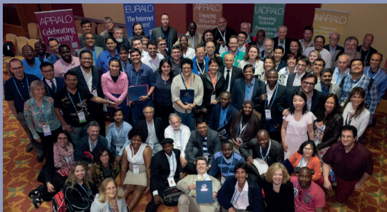
Membres de la communauté At-Large au deuxième Sommet At-Large tenu à Londres en juin 2014.

EURALO est régie par ses propres documents constitutifs, dont un protocole d'accord avec l'ICANN. Son rôle étant clé pour les stratégies régionales de l'ICANN, EURALO travaille avec le département chargé de la relation avec les parties prenantes mondiales de l'ICANN afin d'accroître la sensibilisation à l'infrastructure critique du DNS.