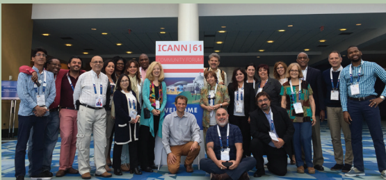
Miembros de la LACRALO en la reunión ICANN61 en San Juan, Puerto Rico.

Actualmente, nuestros miembros comprenden más de 50 Estructuras de At-Large (ALS) ubicadas en 21 países y territorios. Nuestras cifras van en aumento. Las ALS abarcan activistas de tecnologías de la información y la comunicación, organizaciones no gubernamentales y asociaciones que representan a usuarios finales de Internet a nivel local. La LACRALO se rige por sus propios documentos organizativos, incluido un Memorando de Entendimiento con la ICANN. La LACRALO tiene un rol clave en el desarrollo de las estrategias regionales de la ICANN. Trabajamos junto con el equipo de Participación Global de Partes Interesadas de la ICANN para concientizar sobre la infraestructura crítica del Sistema de Nombres de Dominio.