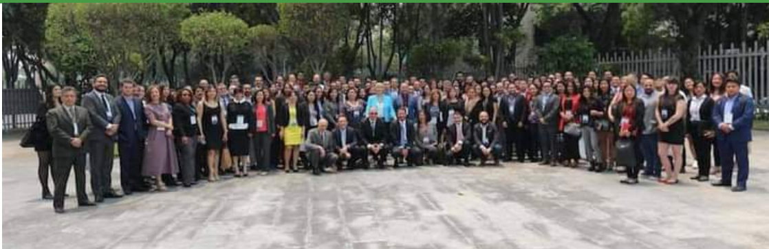
South School of Internet Governance 2020

A 12ª edição consecutiva da South School of Internet Governance , que treinou muitas partes