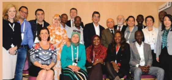
Awọn ọmọ ẹgbẹ AFRALO ati Awọn ọmọ ẹgbẹ agbegbe At-Large ni Ipade ICANN55 ni Marrakesh, Oṣu Karun 2016.

Nipasẹ ipolongo ijade lopolopo, awọn Ọpolopo Awọn Ilana Apoju (ALSes) ti darapo mo AFRALO ni ọdun to ṣeṣe. Die e sii ju 44 ALS ti o wa fun awọn orilẹ-ede 25 lati agbegbe Afirika ṣe aṣẹ AFRALO. Awọn Awọn Ilopo Apoju ni o wa boya Awọn Ijọba Ijọba tabi awọn alagbegbe ti n ṣe atunṣe awọn onibara Ayelujara agbegbe tabi awọn ajafitafita ICT ni apapọ. Wọn ti ni ipa ninu Igbagbara agbara fun awọn agbegbe ti ko ni ipilẹ, iṣafihan ti free ati ki o ṣii software orisun, idagbasoke ti ofin, ilera, ayika, ati ni idagbasoke gbogbo eniyan ni continent lilo awọn Inter-net ni wọn akitiyan.